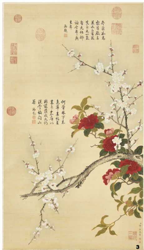
图3 白梅山茶图(清·邹一桂, 收藏于台北故宫博物院) Fig. 3 White plum and camellia (Qing Dynasty, ZOU Yigui, in the Taipei Palace Museum)

茶花》咏此树,“冷艳争春喜烂然,山茶按谱甲于滇。树头万朵齐吞火,残雪烧红半个天” [10] ,将茶花茂盛开放的姿态写得热烈奔放。清林则徐的《万寿山看茶花》“定光寺里珊枝老,可惜今年花不早。菊瓣群夸太极宫,还输万寿庵中好”“梵行寺里端明咏”则提到了昆明的万寿寺、定光寺红山茶,太极宫菊瓣(恨天高),扬州梵行寺的宝珠山茶,可见当时茶花广泛种植于寺庙宫观内外。陈维崧《宴清都·咏杨妃山茶》“几朵僧房吐。东风里,胭脂浅淡偷注。空王斋院,艳阳天气,红香盈树。邻娃漫斗轻盈,尽玉茗、明妆缟素。总输伊,睡足春酥,脸潮分外娇嬬”描写了一株种植在寺庙内的杨妃山茶,