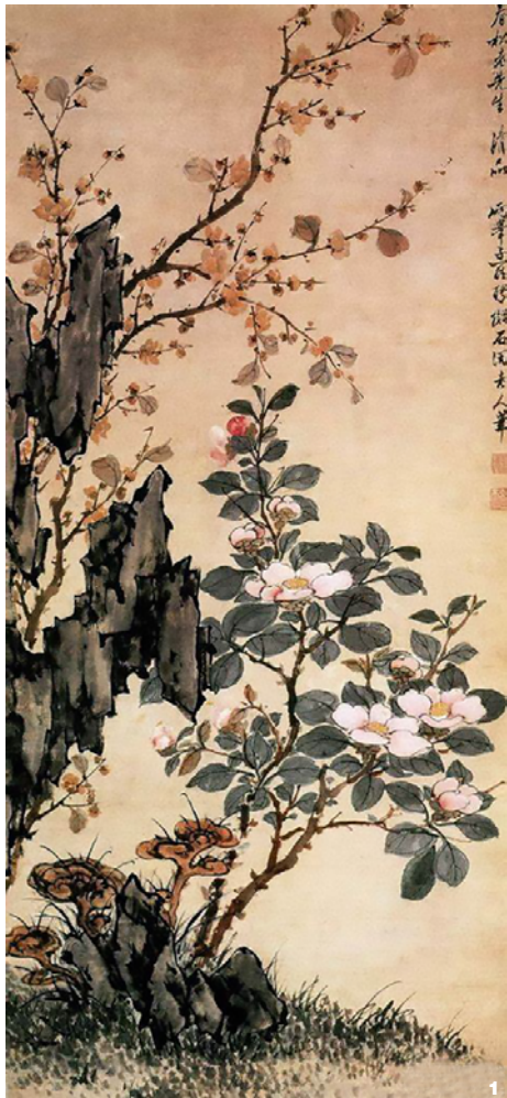
图1 百花图局部 (明·孙克弘, 收藏于故宫博物院) Fig. 1 Part of the Baihua Tu (Ming Dynasty, SUN Kehong, in the Palace Museum)

着一双神态俊逸的雌、雄白雉，石后山茶树枝叶疏落有致，纷纷开着粉红色的花朵。罗聘的《花卉图》以一株粉红花茶花为主体，衬以玲珑的山石和腊梅（图2），推测应用的是当时栽培较为广泛的‘杨妃茶’。