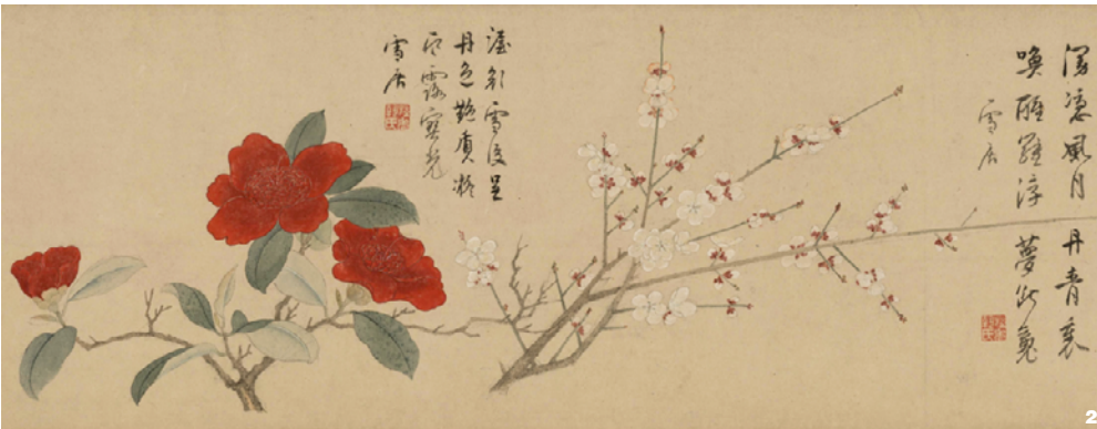
图2 花卉图 (清·罗聘, 收藏于上海博物馆) Fig. 2 Huahui Tu (Qing Dynasty, LUO Pin, in Shanghai Museum)

茶花作为重要的观赏花卉，其花色“由浅红以至深红，无一不备。其浅也，如粉如脂，如美人之腮，如酒客之面。其深也，如