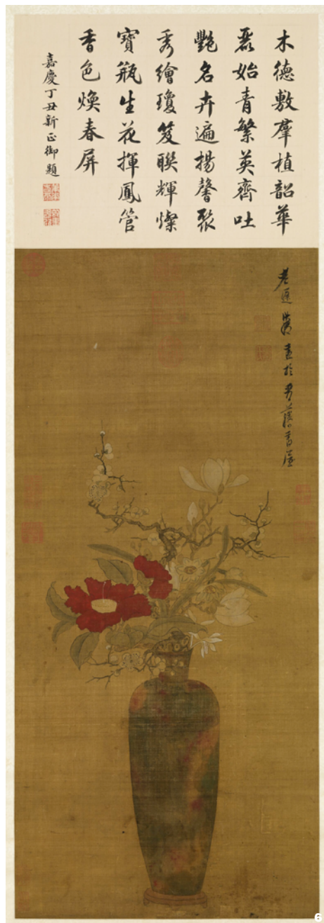
图6 岁朝图轴(明·陈洪绶, 收藏于故宫博物院) Fig. 6 Year-old painting scroll (Ming Dynasty, CHEN Hongshou, in the Palace Museum)

种占中国古代茶花品种的87%, 更是出现了流传至今的珍稀茶花品种。茶花在园林景观中的应用也更为成熟多样, 从地栽、盆栽,