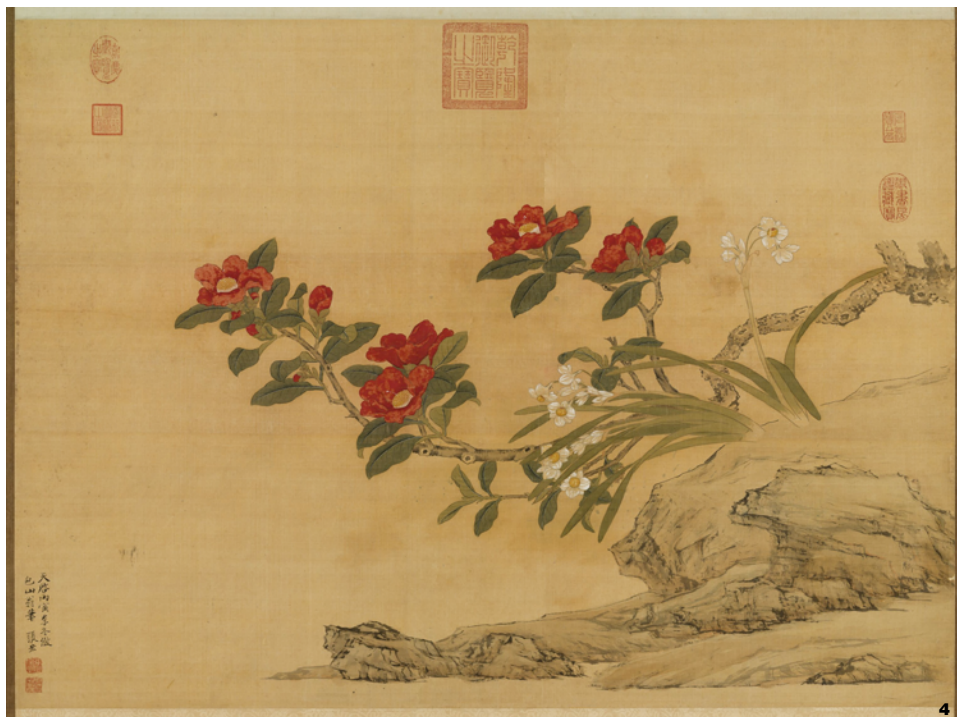
图4 仿陆治茶花水仙轴(明·张宏,收藏于台北故宫博物院) Fig. 4 Imitate of Lu Zhi's camellia and narcissus (Ming Dynasty, ZHANG Hong, in the Taipei Palace Museum)

此外,明代插花艺术开始流行,袁宏道的《瓶史》中对茶花插花艺术进行了较为全面的总结,在很大程度上提升了茶花在插花材料中的地位。其称“黄白茶韵胜其姿”,突出了黄山茶和白山茶在插花时的搭配运用 [18] 。清朱昆田《题雪中山茶画扇》中写道:“凌冬百卉尽飘零,开处常愁素雪停。最好温磨乳炉畔,一枝红插砚头瓶。”陈维崧作茶花词《醉乡春·咏茶花》“瓶里玉花先逗”。明陈洪绶的《麻姑献寿图》,画中两位女仙一主一仆,女仆怀抱的花瓶中插有山茶和梅(图5)。此外,茶花还常与松枝、梅、百合、水仙、天竹等一起作为插花材料,搭配柿子、如意