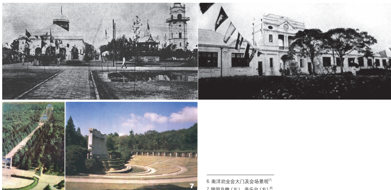
6. 南洋劝业会大门及会场景观 [7] 7. 陵园鸟瞰(左)、音乐台(右) [8]

筑组合而成。前者典型代表为愚园、“金陵学士四园”——薛庐、可园、艺风堂、散园精舍。粉墙黛瓦，江南传统水乡式木构建筑。后者典型代表为玄武湖公园、莫愁湖公园、白鹭洲公园、鼓楼公园等，古今景观相互交织，融为一体。