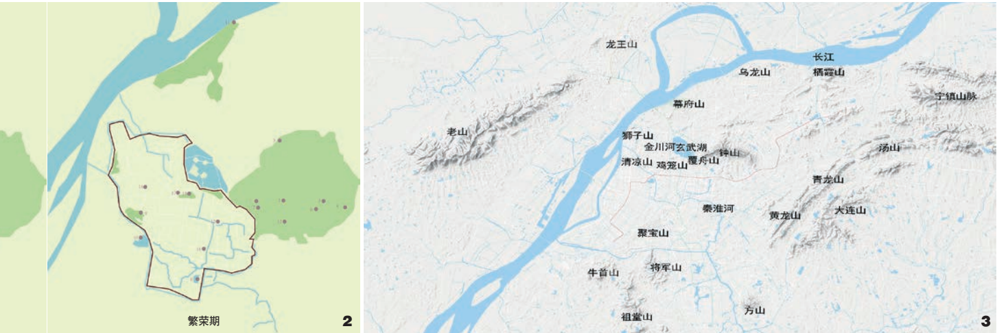
1. 南京近代园林分布图 2. 南京近代园林不同发展期分布图 3. 南京山水格局

林园、纪念陵园、植物园、官邸园林、公建附属园林相继地发展起来，中西合璧式园林风格日趋成熟。1937 ~ 1945年，抗战期间南京沦陷，园林发展进入停滞期，且众多园林佳作毁于战乱。